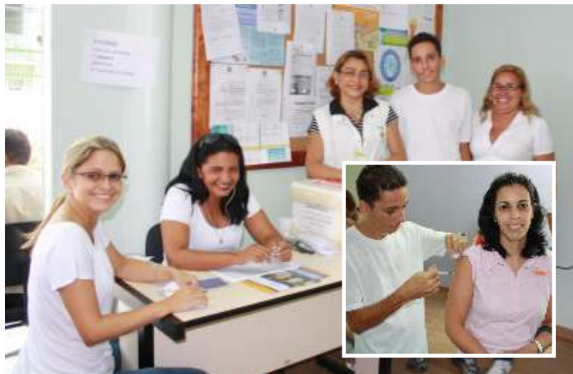
Equipe responsável pela vacinação. Em ação no detalhe.